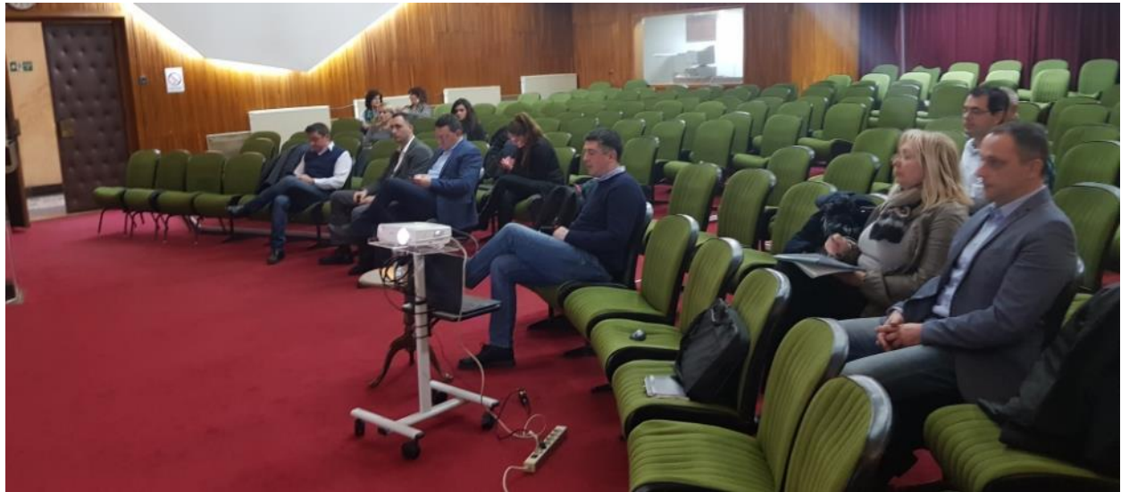
Slika 4. Javne konsultacije u Kragujevcu, 7. februar 2019. godine

Ukupno 16 učesnika prisustvovalo je sastanku javnih konsultacija u Kragujevcu, uključujući predstavnike Kancelarije za informacione tehnologije i elektronsku upravu, predstavnika svih relevantnih odeljenja uprave Grada Kragujevca, javnih komunalnih preduzeća i zaposlenih koji su uključeni u proces eksproprijacije (Slike 4, 5 i 6).