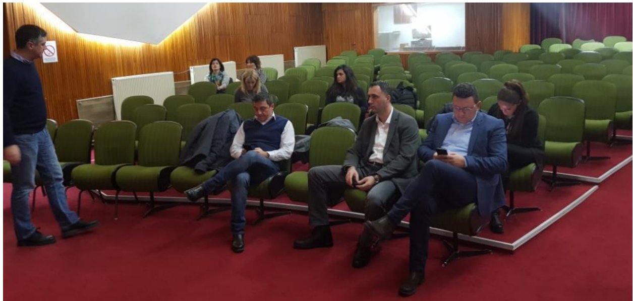
Slika 5. Javne konsultacije u Kragujevcu, 7. februar 2019. godine