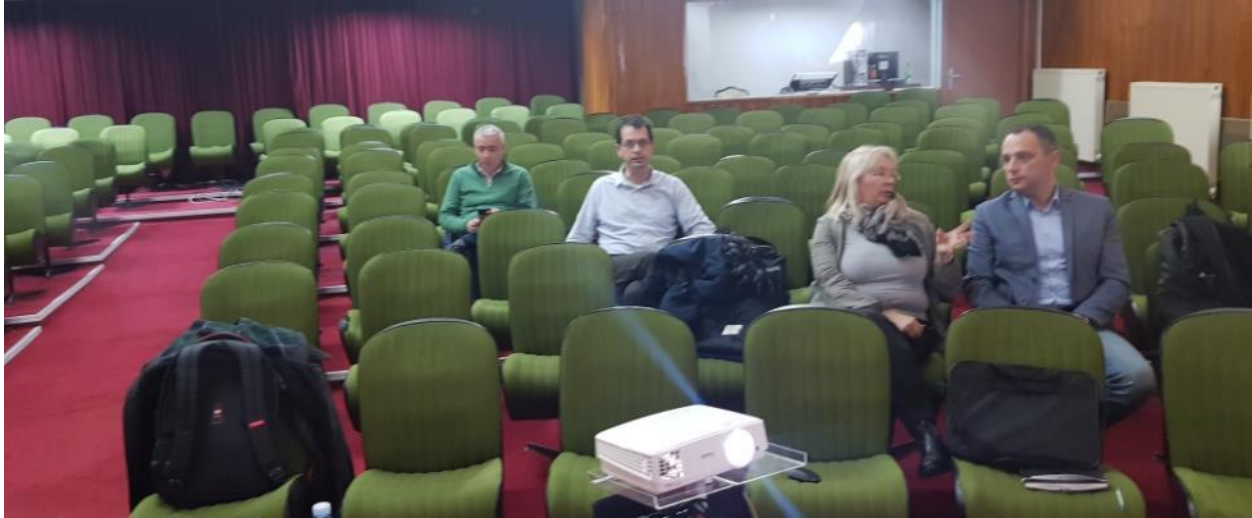
Slika 6. Javne konsultacije u Kragujevcu, 7. februar 2019. godine

Sastanak je počeo prema rasporedu u 12:00 časova.